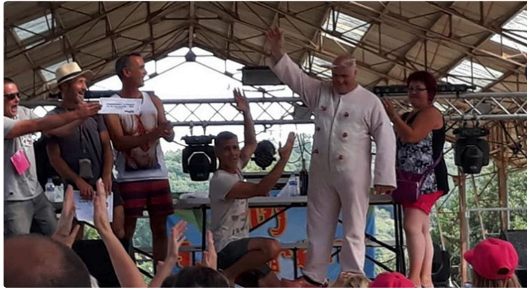
Pourcailhade 40 ans de festivités hors du commun

Une fête qui a un petit goût de reviens-y