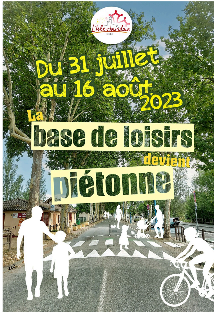
Piétonnisation de la base de loisirs de l'Isle-Jourdain.