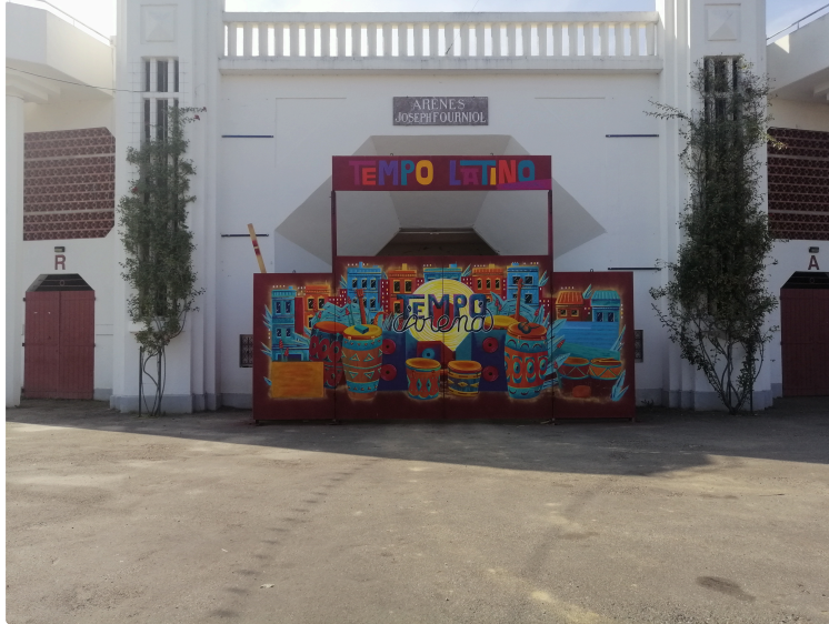
Une diva mexicaine et une rockstar afro-cubaine samedi soir et un riche programme pour le reste de la journée !