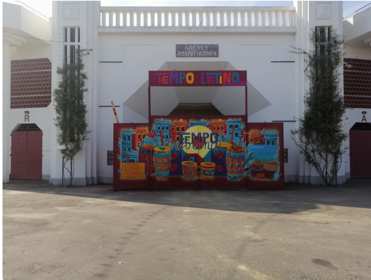
Inauguration du festival et soirée de l'afro-cubain par excellence !