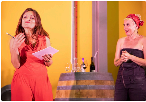
Jeux de scène