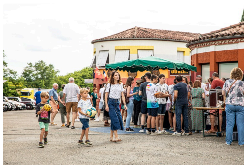
Le public visite et boit un verre