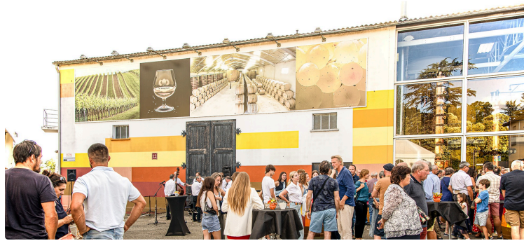
Les 13 et 14 juillet, le 60e anniversaire des Hauts de Montrouge a attiré un large public à Nogaro (I)

Le 13 juillet a été marqué par un spectacle chanté des «Attracteurs étranges»