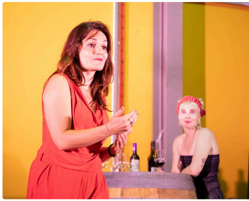
Jeux de scène