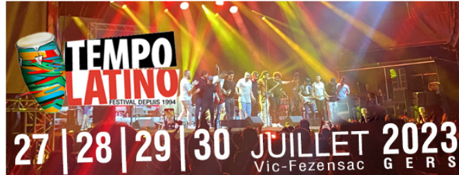
Tempo Latino 2023 : infos pratiques du Primo festivalier !