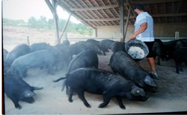
La fête du cochon à la ferme de Bidache