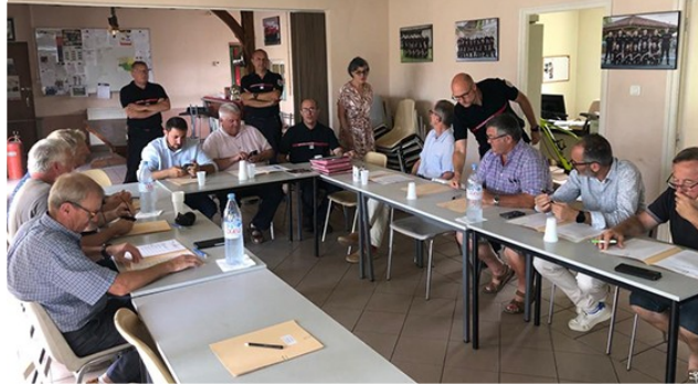
Réhabilitation du centre d'incendie et de secours.