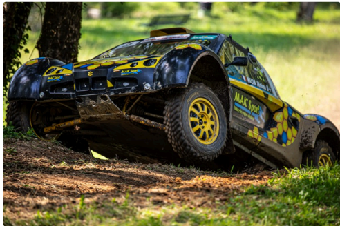
Sans numéro visible