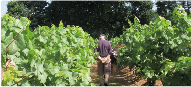
Programme estival Pass'enGers

Les guides-conférencières de Pass'enGers sont à pied d'œuvre pour faire découvrir le patrimoine gersois au public tout au long de l'été.