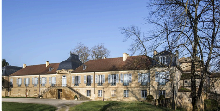
Expositions au château avec l'association CHAM

De quoi satisfaire tous les goûts, tous les curieux