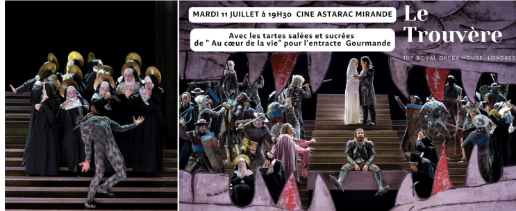
Soirée Ciné-Opéra à Mirande : Une expérience sensorielle entre musique et gourmandise avec Le Trouvère de Verdi

Verdi au Ciné de Mirande: Ciné opéra et entracte gourmande