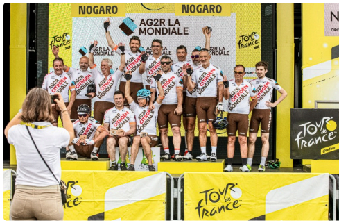
Les cyclos de la Mondiale sur le podium