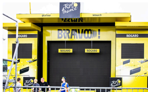
Le bâtiment du podium surgi du néant