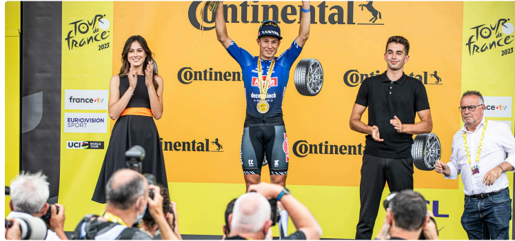
La caravane et les installations du Tour de France à Nogaro (I)

La journée du mardi 4 juillet est très occupée : le matin, les équipes du Tour finissent la mise au point opérationnelle de la montagne de matériels mise en place au bord du circuit Paul-Armagnac et, dès le début de l'après-midi, on assiste :