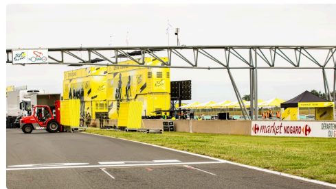
Un bâtiment a surgi