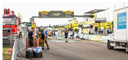
Préparation de la ligne d'arrivée