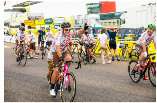
Départ des cyclos de la Mondiale