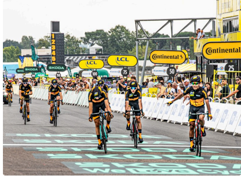
Un groupe de jeunes à l'arrivée