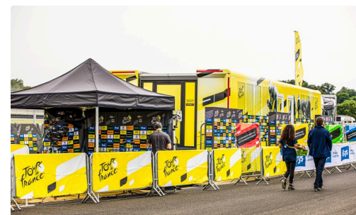
Installations à droite du podium