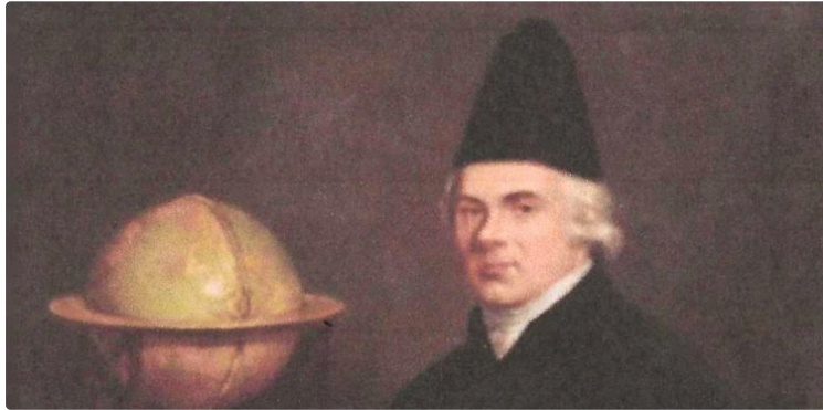
Communications à la Société archéologique

Lors de sa réunion mensuelle, la Société Archéologique du gers a pris connaissance de deux nouvelles communications.