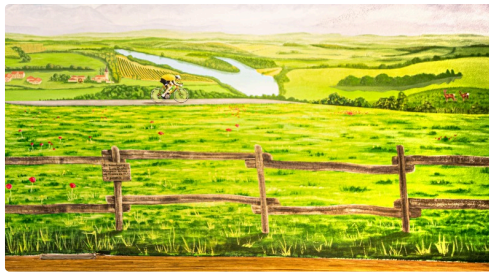
Luis Ocaña représenté sur la toile de fond de la salle