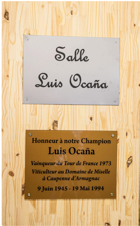
La plaque Luis Ocaña