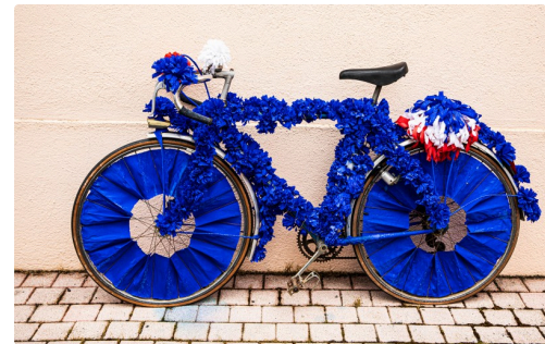
Autre vélo décoré