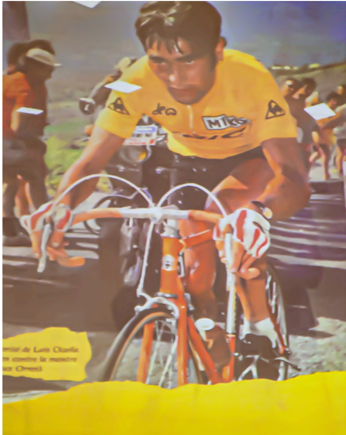
Photo de Luis Ocaña projetée sur l'écran de la salle des fêtes

Aujourd'hui, nous rendons hommage à Luis Ocaña, vainqueur du Tour il y a 50 ans et « qui, tombé sous le charme de la propriété de Miselle, était venu s'installer avec son épouse (...) en 1972 ».