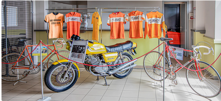
Une plaque dans la salle des fêtes consacrée à Luis Ocaña à Caupenne-d'Armagnac

Une salle mini-musée éphémère dédié à Luis Ocaña