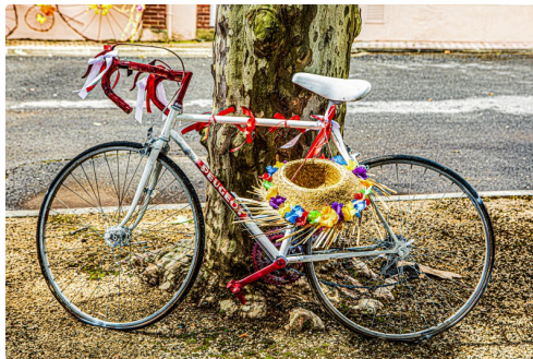
Autre vélo décoré