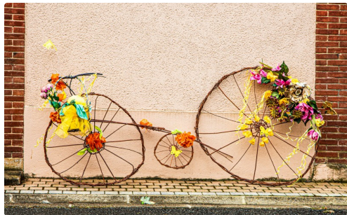
Vélo en vigne tressé