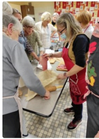
cours de cuisine.