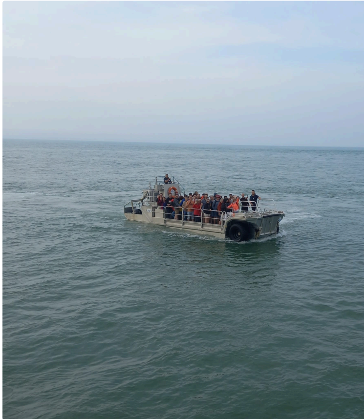
Quand les membres de la gymnastique volontaire vicoise découvrent le Médoc et ses environs...

Pour les 50 participants du club à ce week-end de fin de saison 2022-23, le rendez-vous était donné à 6h Place du Collège à Vic pour un départ à la découverte du « Médoc » et de ses environs : ses plages de sable fin, son immense forêt et son prestigieux vin sans parler du Phare de Cordouan à la Pointe de la Gave.