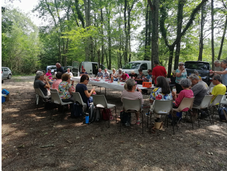
Section marche santé du club de gymnastique volontaire : le bois de Mazous comme cadre pour la dernière marche de la saison

Mardi 27 juin, c'était la dernière marche santé de la saison pour le club de gymnastique volontaire vicoise.