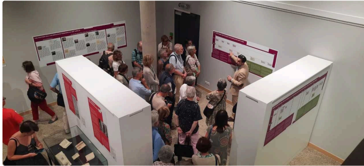
Congrès archéologique national 2023 dans le Gers