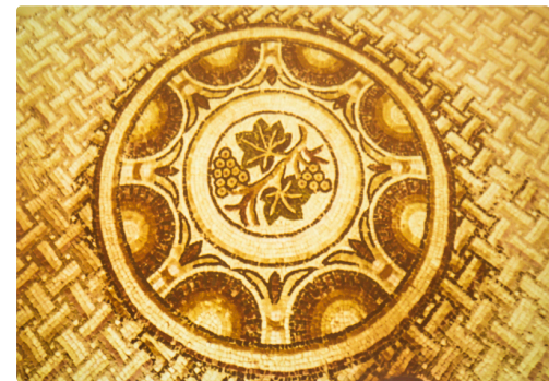
Mosaïque de Séviac à Montréal-du-Gers - Document Jacques Lapart - Photo de l'écran par Roland Houdaille