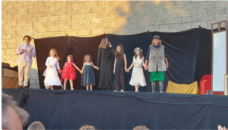
Le bonheur est dans le pré quand le théâtre s'y invite !

Quelle jolie idée que de proposer un spectacle de fin d'année en pleine campagne !