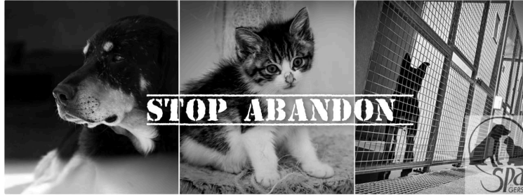
Journée mondiale contre l'abandon des animaux de compagnie

Samedi 24 juin, c'était la journée mondiale contre l'abandon des animaux de compagnie.