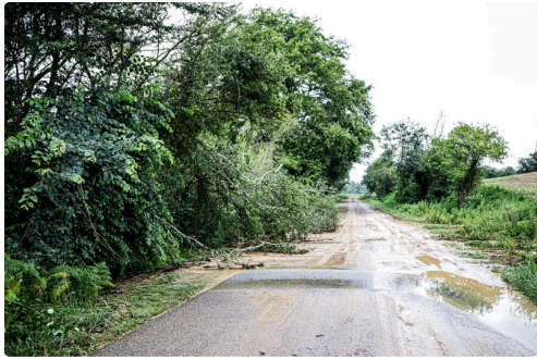
Dégâts ur la route Aignan - Nogaro