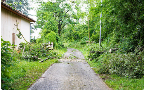
Chemin de la gare à Fustérouau passage dégagé par les habitants