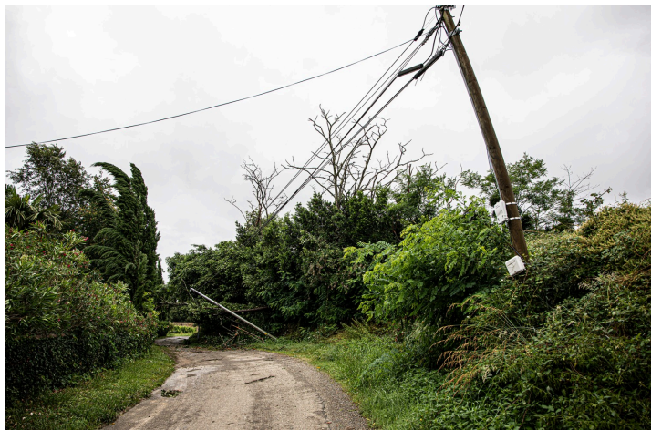
Vu de l'autre côté, le poteau métallique va être redressé

À Bouzon-Gellenave, la route qui traverse Bouzon du village de Sorbets à Saint-Gô est particulièrement touchée : comme c'est souvent le cas, la côte partant du petit pont sur le Midour est inondée. Mais sur la crête, des arbres sont tombés sur les réseaux de câbles et d'autres arbres obstruent le passage. Une tornade, que les habitants d'une maison ont vu monter vers eux, a emporté la moitié de leur toiture.