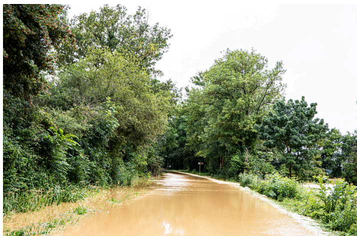
La route Nogaro - Aignan près du pont de la Ribérette