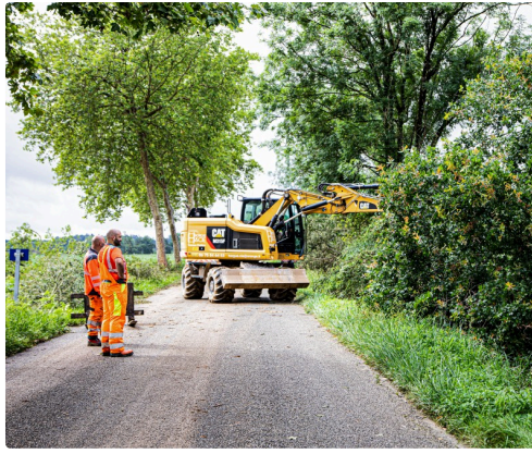
La DDE libère la route Aignan - Nogaro