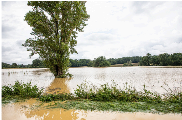
Autre champ au bord de la route Aignan - Termes-d'Armagnac