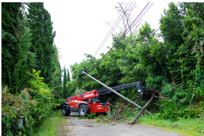
L'engin commence par évacuer l'arbre qui pèse sur le poteau

À Bouzon-Gellenave, la route qui traverse Bouzon du village de Sorbets à Saint-Gô est particulièrement touchée : comme c'est souvent le cas, la côte partant du petit pont sur le Midour est inondée. Mais sur la crête, des arbres sont tombés sur les réseaux de câbles et d'autres arbres obstruent le passage. Une tornade, que les habitants d'une maison ont vu monter vers eux, a emporté la moitié de leur toiture.