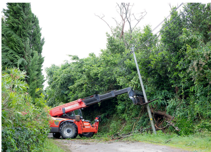
Puis l'engin redresse le poteau

Le courant électrique est coupé et ne revient, dans le quartier de Bouzon, que dans deux maisons, à 10 h 30.