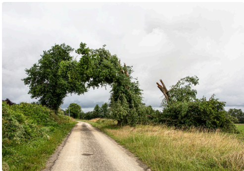
Un arc de triomphe précaire sur le chemin de la gare de Fustérouau