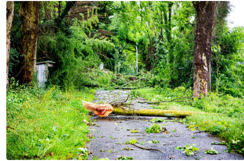
Chemin de la gare à Fustérouau