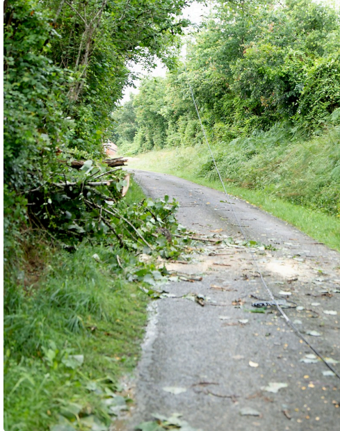
Un câble traverse le chemin de la gare de Fustérouau