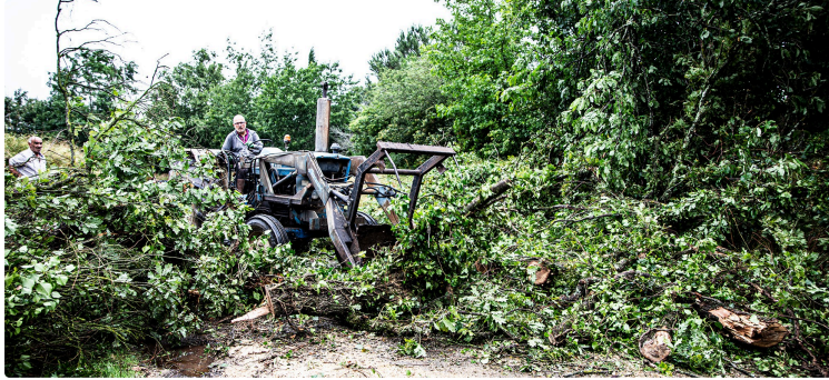
Dégâts de la tempête du 22 juin 2023 à Bouzon-Gellenave et Fustérouau

Arbres déracinés, arbres cassés, toiture envolées, coulées de boue sur les routes, champs inondés etc.