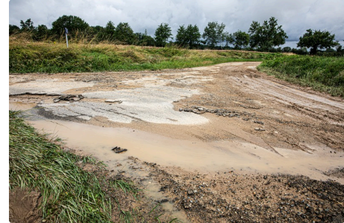
Le chemin de la gare de Fustérouau défoncé et couvert de boue