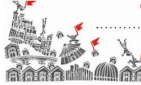
Demain : Shooting et exposition pur fêter l'été avec CIRCA au Garros