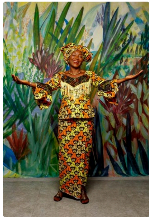
portraits de famille.jpg

Ce projet s'inscrit dans le cadre de la Fête de l'été dans le quartier du Grand Garros. Il est accompagné par le Dispositif Quartier d'été dans le cadre de la politique de la Ville avec le soutien de la Préfecture du Gers.