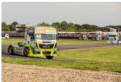
Course 4 : le n°44 ; bientôt en tête, Téo Calvet est encore 5e