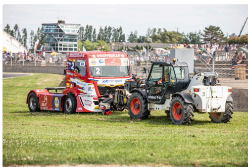
Course 2 dépannage du n°2 Lionel Montagné