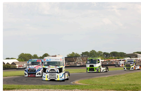
Course 4 : Téo Calvet n°20 est 3e derrière le 15