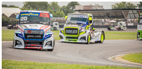
Course 3 : 1er le n° 20 Téo Calvet

Tous alignés pour l'épreuve de mécanique !