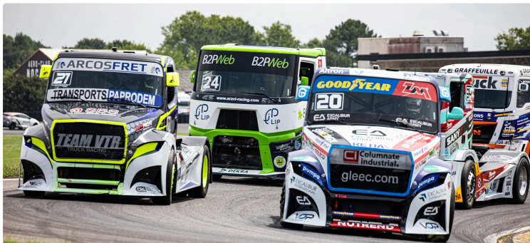
Les courses de camions à Nogaro : Grand Prix Camion (II)

Téo Calvet sur son Buggyra domine la compétition