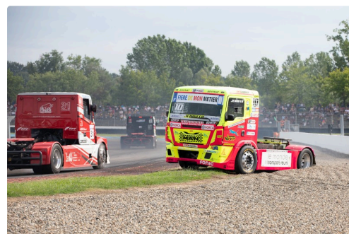
Course 4 : Tête-à-queue sans gravité du n°10 Jennifer Janiec sur Man TGS