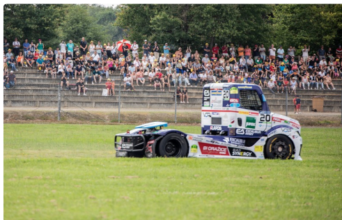
Course 3 : idem