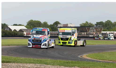
Course 4 : Téo Calvet termine en tête