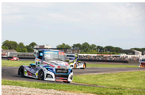
Course 4: Téo Calvet est parti de la 8e place