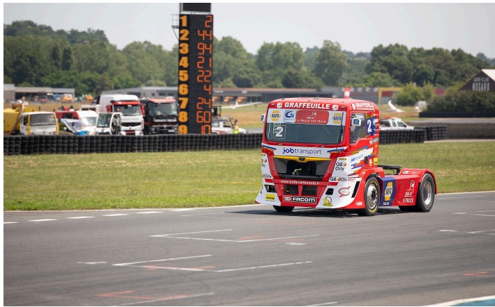
Course 1 : 1er le n°2 Thomas Robineau Team Robineau

et plus tard à la superpole 1 et à la superpole 2.