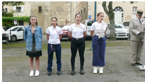
Les 4 jeunes du SNU.