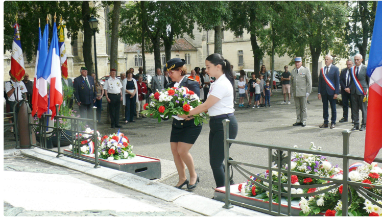
83ème anniversaire de l'appel du 18 juin 1940

La cérémonie de cet acte fondateur a vu la participation de 4 SNU