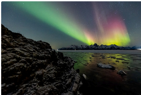
Festival de photographie

1er septembre 18h, ouverture de la Quinzaine prend l'Aire , parvis de la médiathèque, suivie par une visite guidée d'expositions. Aire sur l'Adour – 17 septembre 14h30, conférence avec Jérôme Fourcade, lauréat du concours jeunes talents, à la médiathèque. Aire sur l'Adour – 15h30 visite guidée d'expositions, RDV en Mairie – 29 septembre 18h30 cérémonie de clôture. Aire sur l'Adour – 20h projection d'un film en lien avec la photographie.