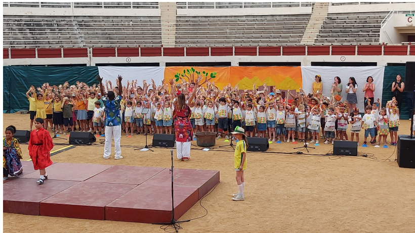
...une cruche en Océanie...