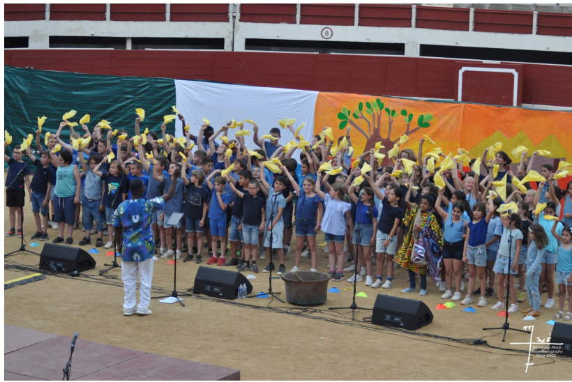
...des grains de café en Amérique...