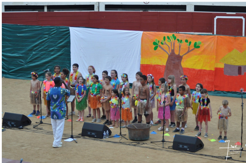
Et le miracle du retour de l'eau s'est produit !