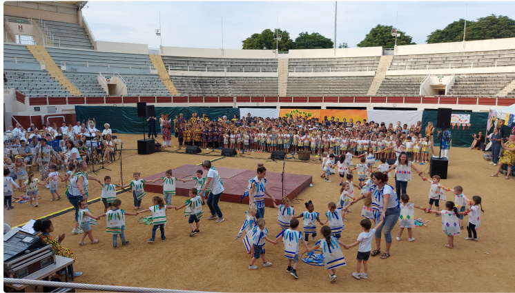
Plus de 500 enfants et musiciens dans les arènes vendredi soir pour un beau spectacle collectif !

Videos et galerie-photos en fin d'article !