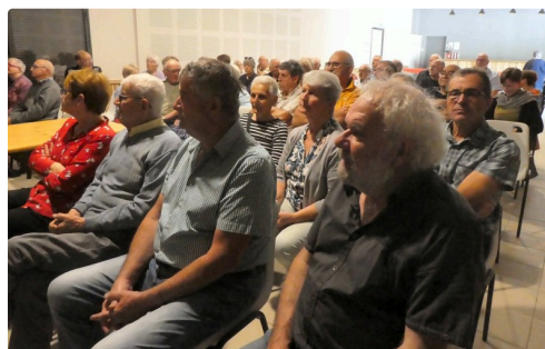
Pas une place libre dans la salle des fêtes de Tachaires