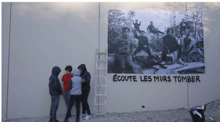
Soirée solidaire et militante à l'occasion de la journée mondiale du réfugié

Dans le cadre de la journée mondiale du réfugié, la Coordination des Collectifs de Migrants du Gers (CCM32) organise