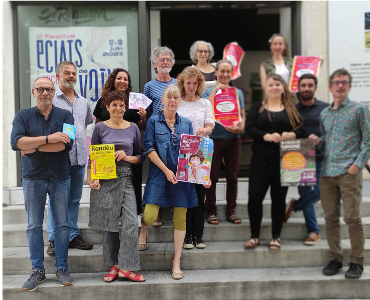
Musique, poésie, théâtre , contes, danses ... au programme de l'été, les associations font leur festival

L'Adda du Gers, en lien étroit avec le Comité Départemental du Tourisme, s'attache à accompagner les festivals et événements culturels gersois dans une transition écologique collective et vertueuse, quelques uns d'entre eux ont été présentés récemment .