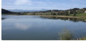
Lous Quarantapes au lac

Nous vous proposons donc d'aller découvrir une balade de 11,5 kms autour de Sère-Rustaing et de son barrage-réservoir sur le Bouès. Cette randonnée était envisagée au mois de mai et avait été remplacée par la dernière étape de la transhumance.