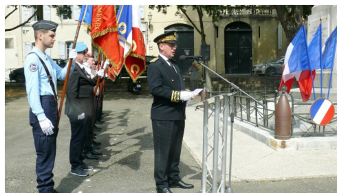
Lecture du message ministériel par le préfet du Gers.