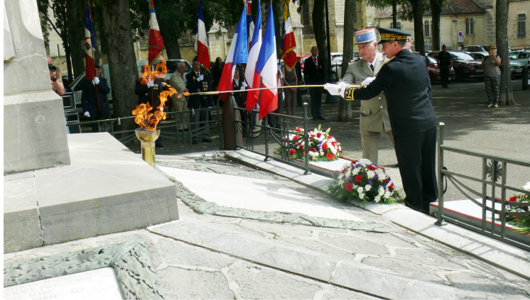
commémoration de la guerre d'Indochine

Jeudi 8 juin à 11 heures au monument aux morts de la place Salinis à Auch s'est déroulée la cérémonie de commémoration de la guerre d'Indochine en présence des autorités civiles et militaires et des associations d'anciens combattants. Cette journée nationale d'Hommage aux morts pour la France en Indochine a été instituée par le décret du 26 mai 2005.