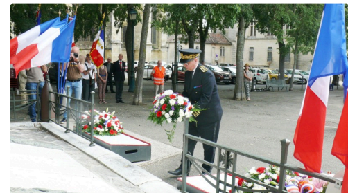
Dépôt de la gerbe par le préfet du Gers.