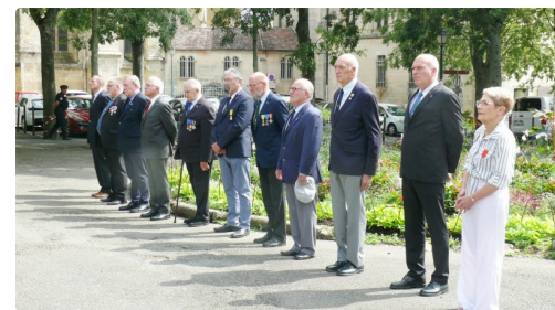
Les autorités civiles.