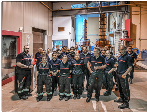
Le groupe de sapeurs-pompiers pose après l'exercice