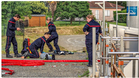
Réanimation d'un blessé