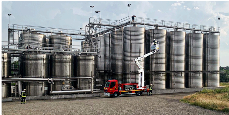
Incendie et secours à la personne: exercice des sapeurs-pompiers de Nogaro à la Cave des Hauts de Montrouge

Avec déploiement d'un bras élévateur articulé