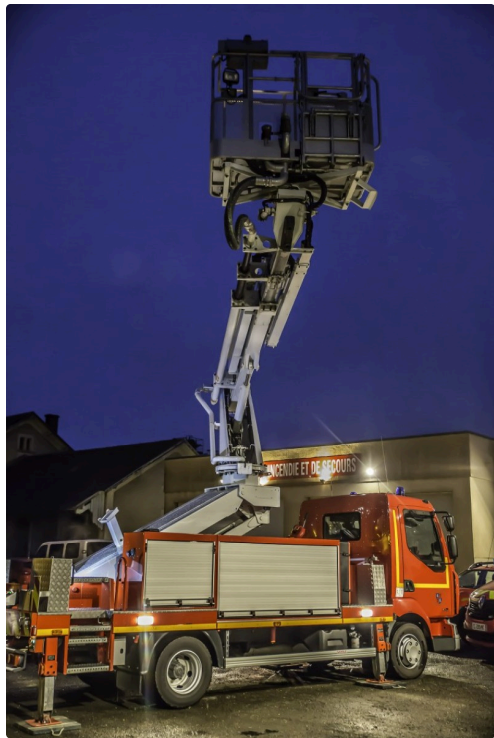
Déploiement du BEA (bras élévateur articulé) à Nogaro lors de sa réception le 26.11.2016