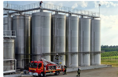
Arrivée du camion porteur du bras élévateur articulé