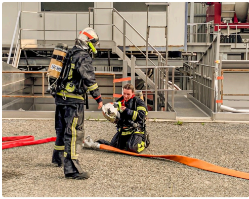
On s'équipe