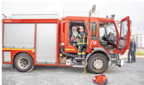
Démontage de l'exercice