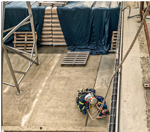
Les mêmes vus de l'autre côté