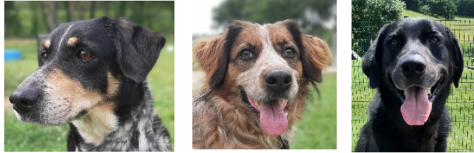
Milka, Nickie et Malonne à l'honneur cette semaine !

Cette semaine, la SPA vous présente deux demoiselles et un jeune chien , tous les trois arrivés récemment au refuge.