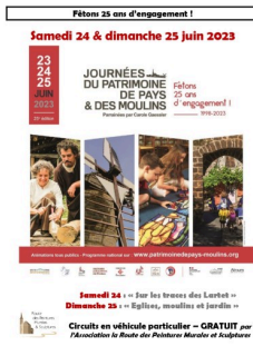
Journées Patrimoine 2023 2.jpg

Samedi 24 & dimanche 25 juin 2023 JOURNÉES DU PATRIMOINE DE PAYS & DES MOULINS Fêtons 25 ans d'engagement ! www.patrimoinedepays-moulins.org Samedi 24 - Sur les traces des Lartet - Dimanche 25 - Églises, moulins et jardins - Circuit en véhicule particulier - GRATUIT par l'Association de la Route des Peintures Murales et Sculptures