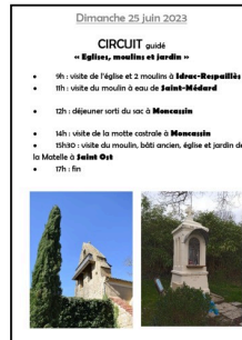
Journées Patrimoine 2023 1.jpg

Dimanche 25 juin 2023 CIRCUIT guidé - Églises, moulins et jardins - 9h: visite de l'église et 2 moulins à Idrac-Respaillès 11h: visite du moulin à eau de Saint-Médard 12h: déjeuner sorti du sac à Moncassin 14h: visite de la motte castrale à Moncassin 15h30: visite du moulin, bâti ancien, église et jardin de la Matelle à Saint-Ost 17h: fin