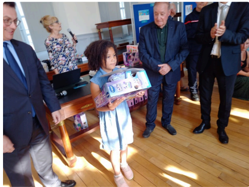
Des cadeaux plein les bras.