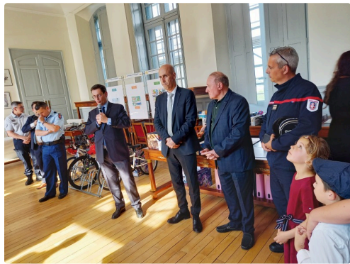
Les personnalités qui ont participé à l'élaboration di concours de dessins.