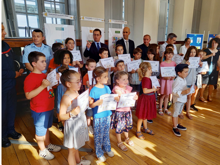
Concours de dessin sur la sécurité routière : 21 lauréats récompensés

C'est dans les salons de la préfecture que le mercredi 31 mai en début de soirée que se déroula la remise des prix du concours de dessins sécurité routière 2022-2023. Une cérémonie qui se déroula en présence du préfet du Gers, Xavier Brunetière, qui en profita pour sensibiliser les 21 jeunes lauréats aux dangers liés à la sécurité routière. Lesquels ont été sélectionnés parmi les 575 dessins réceptionnés issus de 8 centres de loisirs et de 18 écoles. Ce concours qui avait pour thème : « Pour être un piéton en sécurité, je fais attention et je me protège », était organisé en partenariat avec l'Education nationale, la Prévention routière, la gendarmerie et la police.