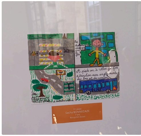
Dessin de Sacha Bonnecaze.