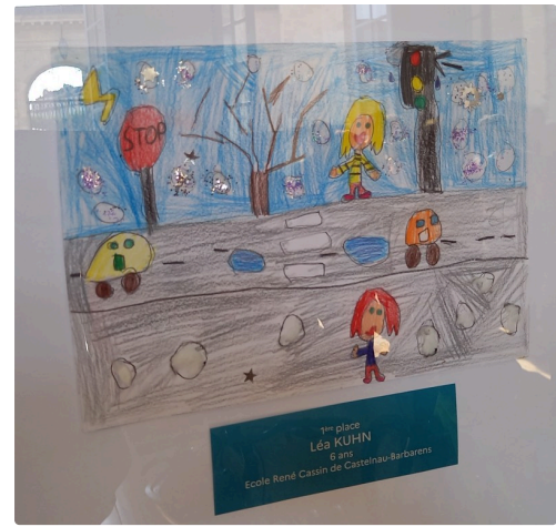
Dessin de Léa Kuhn.