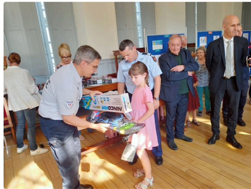
Des cadeaux plein les bras.