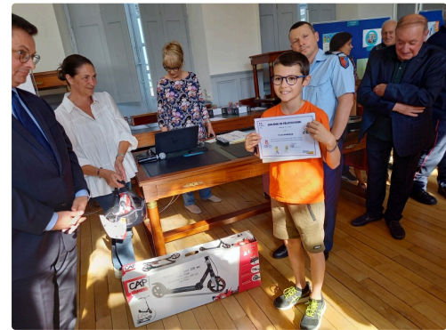
Des cadeaux plein les bras.