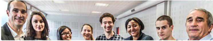
Nogaro - Supaéro pousse les jeunes Nogaroliens vers les études d'ingénieur

Le projet Scratch les accompagnera du primaire au supérieur