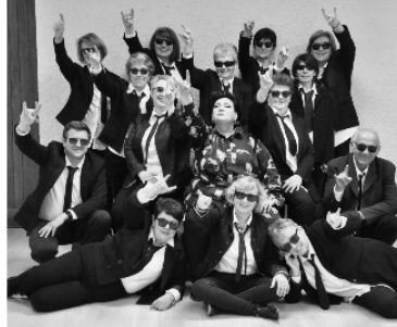
Les Pops Castafiores en concert, c'est bon pour la santé!

Les Pops Castafiores poursuivent leur périple gersois et se produiront