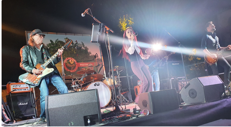
Rock à Roques !