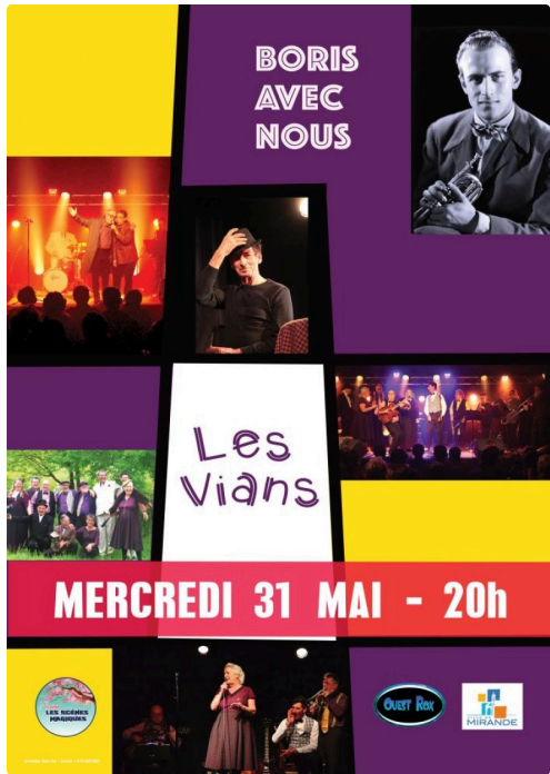
Affiche Les Vians