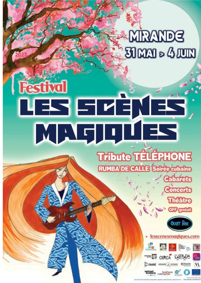
Le Festival Les Scènes Magiques ouvre ses portes

"L'idée est de rendre la culture accessible à tous, que l'argent ne soit pas un frein"