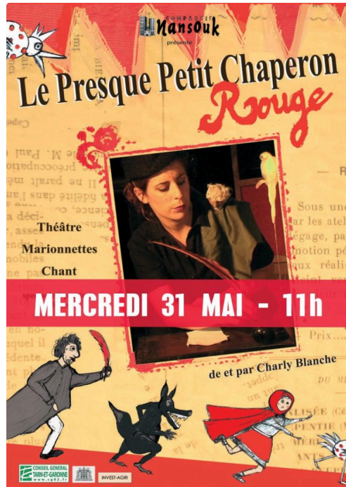
Affiche Presque Petit chaperon rouge