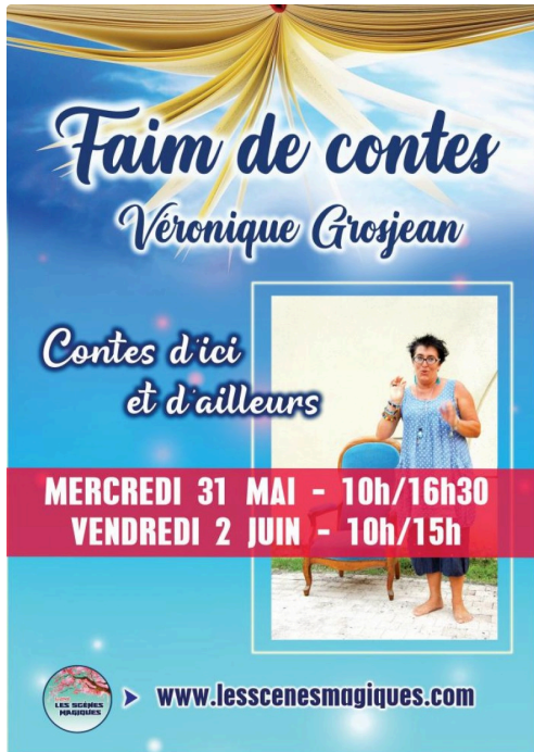
Affiche Faim de contes