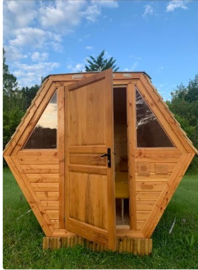
Inédit : Hygie Sport démarre les siestes relaxantes avec l'apithérapie