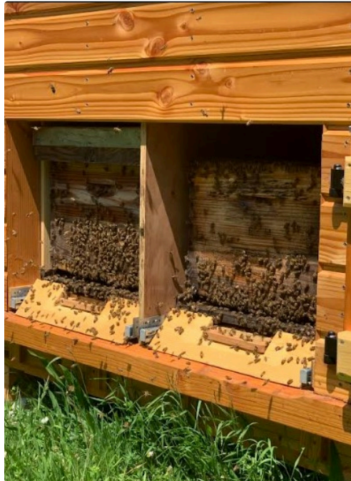
la maison des abeilles vue de dos

A partir du 5 juin, des siestes relaxantes, de 30 minutes, dans la cabane d'Apithérapie, Bulle de miel,