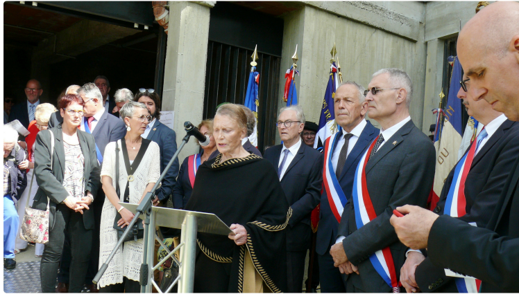
Le musée de la Résistance et de la déportation inauguré

Ce musée comprend cinq espaces distincts, le contexte, la Résistance dans le Gers, la déportation, la Shoah et la Libération.