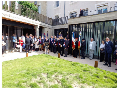
Entrée du musée.