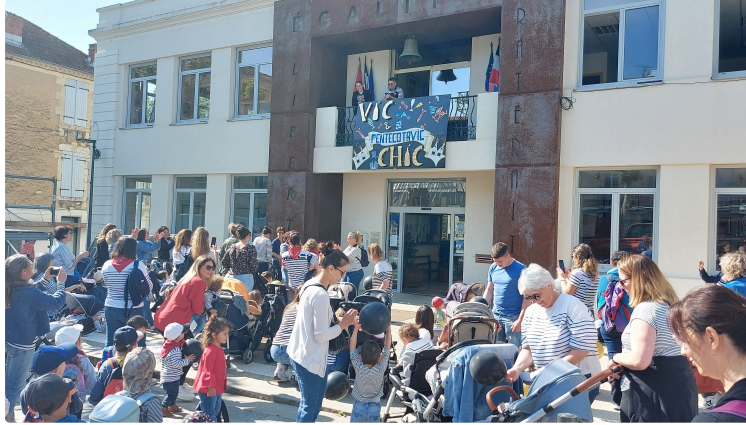
Pentecôtavic 2023 : les tout-petits ouvrent les festivités !