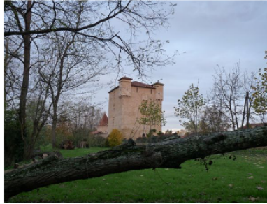
Portes ouvertes de Pentecôte à Herrebouc : 13ème édition ce week-end !