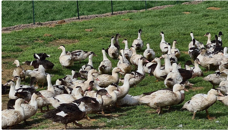
Influenza aviaire : un premier foyer détecté et confirmé dans un élevage de volailles de l'Astarac