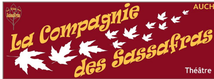
Clap de fin de la saison théâtre des Sassafras

Le samedi 27 mai, la Compagnie auscitaine des Sassafras fêtera la dernière date de sa saison de théâtre amateur.