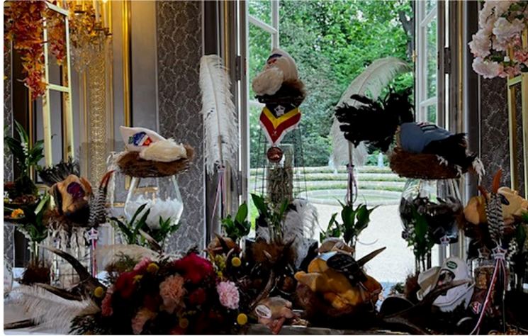
Un Chapon et quel chapon à l'Elysée !