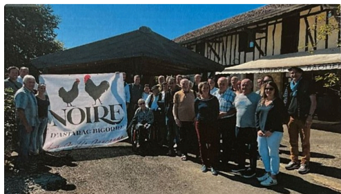
chapon noir gascogne abadie.JPG