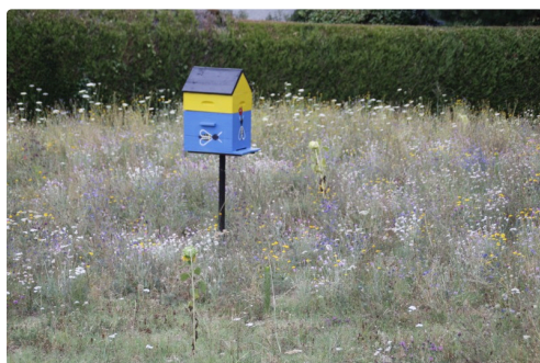
Biodiversite La Tourette 23072022 (12).JPG