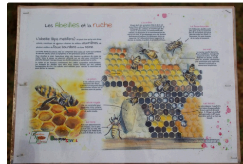
Biodiversite La Tourette 23072022 (5).JPG