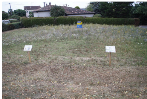
Biodiversite La Tourette 23072022 (2).JPG

Cette réalisation du personnel des espaces verts apporte sa contribution à la candidature de Miélan dans le cadre des villes et villages fleuris du Gers.