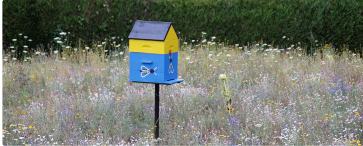
Un choix dans la biodiversité

Les services techniques de la ville de Miélan ont fait un choix en biodiversité pour respecter un espace fleuri.