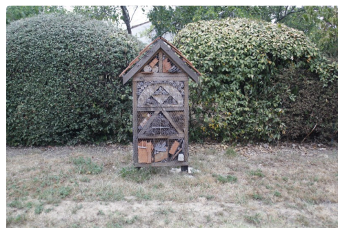
Biodiversite La Tourette 23072022 (9).JPG