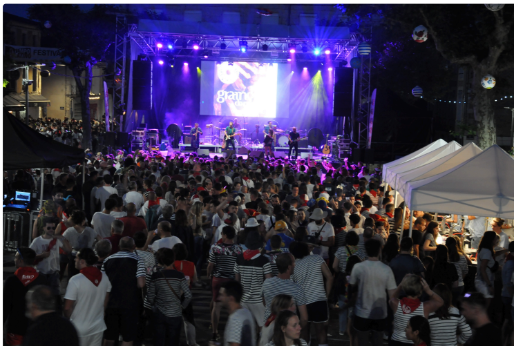
Pentecôtavic 2023 : distribution des bracelets gratuits et des laissez-passer à partir de lundi 15 mai

Dans le cadre des festivités de Pentecôtavic, le périmètre de la fête sera fermé et payant pendant 3 jours.